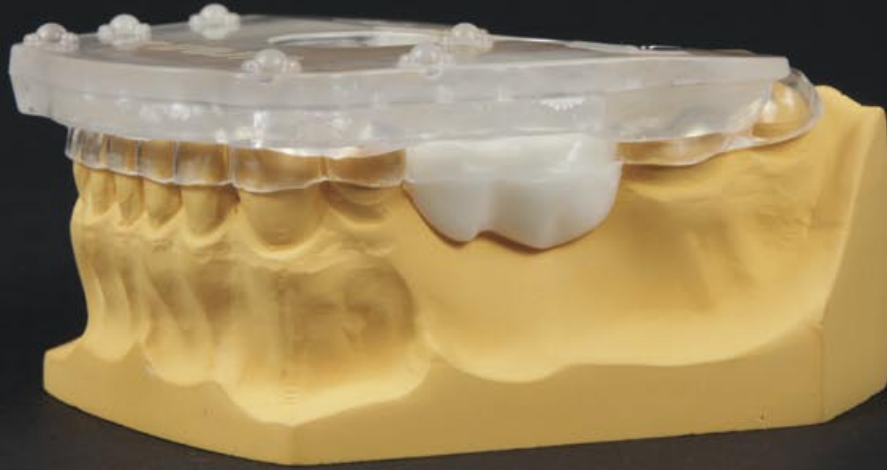
Tiefziehschiene mit Kronenvorschlag und Aufbissplatte.