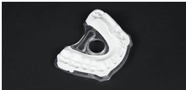
Aufbissplatte mit Bissregistrator.