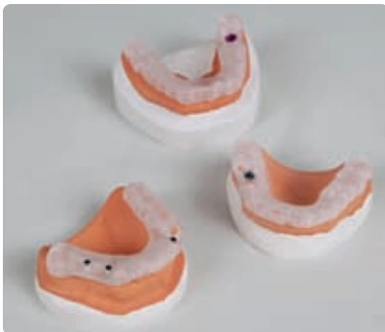
Abb. 3 Die aus der Planung generierten OPTIGUIDE Bohrschablonen

aus. So ist beispielsweise die Anschaffung eines DVT- oder CT-Systems nicht notwendig, da die Software mit sämtlichen Datensätzen im DICOM Format arbeiten kann. Diese können ohne großen Aufwand direkt eingelesen werden. Die Software wird kontinuierlich mit neuen Features und Modulen erweitert. Seit Oktober 2011 gibt es diverse Neuerungen wie die Abutmentplanung, die Bohrhülsevisualisierung sowie die Schnittstelle zu VDDS Media. Nach der Diagnose- und Befundung kann der Behandler per Mausklick die gewünschten Implantate und Abutments aus der Datenbank wählen und in der Software planen. Die neu entwickelte Bohrhülsevisualisierung bietet die Möglichkeit, die Umsetzbarkeit der Planung sofort am Bildschirm zu überprüfen. Somit können eventuelle Komplikationen vorab vermieden werden. Auch die Umsetzung der Planung in eine patientenindividuelle Bohrschablone bleibt flexibel. Zahngetragen, schleimhautgetragen (mit oder ohne zusätzliche Fixierung) sowie das Hülsensystem wählt der Behandler je nach Bedarf selbst aus. Eine hohe Qualität sowie ein präzises Prüfsystem gehören zum Standard.