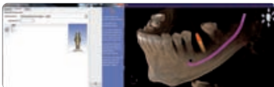
Abb. 1 Planung von Implantat und Abutment

Die Implantatplanungssoftware SICAT Implant, mit integriertem Diagnose- und Befundungstool, zeichnet sich durch offene Schnittstellen und eine einfache Bedienung